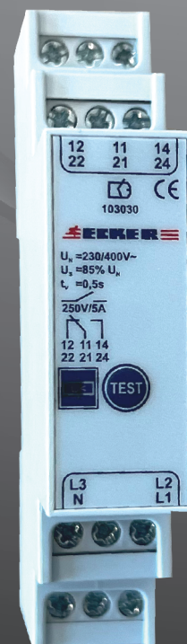
Abmessungen DNÜ 103030